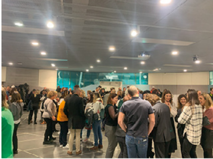
11 janvier 2024 Cérémonie des vœux du CHU Grenoble Alpes

25 avril Remise de chèque par le Rotary Club